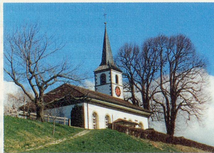
Kirche Rüschegg am Palmsonntag 2002.

Wohl die meisten der anwesenden ehemaligen Konfirmandinnen und Konfirmanden folgen in Gedanken ihrem Lebensweg zurück bis zu ihrer Konfirmation vor fünfzig Jahren. «Es isch scho ygfahre», sagt nach dem Gottesdienst