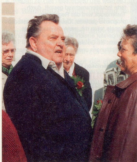
Wiedersehen vor der Kirche: Die ehemaligen Konfirmandinnen und Konfirmanden sind schon bald in ein Gespräch vertieft.