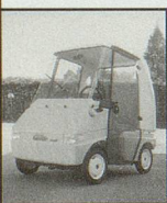
Kabine mit Heizung

Wenn gehen schwerfällt Allwetter-Elektro-Mobile führerscheinfrei