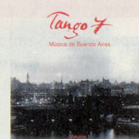
Tango 7 , Musica de Buenos Aires, Zyt- glogge 4516/4523 Vol. 1, CHF 32.50 Vol. 2, CHF 35.–