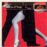
Women of Tango EMI Hemisphere 4 96412 2 8 CHF 19.50

Frauen tauchen zwar in fast allen Tangotexten auf, aber bis vor kurzem war die Tangoszene ausschliesslich eine Welt der Männer. Nur sie durften ein Orchester leiten oder gar das Bandoneon spielen. Das hat sich erst in neuerer Zeit geändert. Was es aber in dieser Musik seit langem gibt, sind Tänzerinnen und Sängerinnen. Heute sind es vor allem sie, die den gesungenen Tango pflegen und weiterentwickeln. 15 dieser «Tangueras» oder «Cancionistas» sind auf dieser CD vertreten. Eine von ihnen trägt sogar einen japanischen Namen. rb