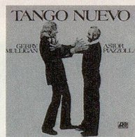
Gerry Mulligan – Astor Piazzolla Tango Nuevo Atlantic 250 168 CHF 23.50

Der wohl grösste Komponist und Interpret des Tangos, Astor Piazzolla, lebte in den Siebzigerjahren in Mailand. Hier kam es 1974 zu einer denkwürdigen Begegnung zwischen dem Bandoneonisten mit seiner Band und dem Jazz-Baritonsaxophonisten Gerry Mulligan. Als «Unterströmung» ist Tango im Jazz von Anfang an spürbar. «Tango Nuevo» gehört zu den ersten gelungenen Versuchen einer Verschmelzung. Wundervoll, wie sich Mulligan in die dunkle, eindringliche und gleichzeitig elegante Musik von Piazzolla einpasst. rb