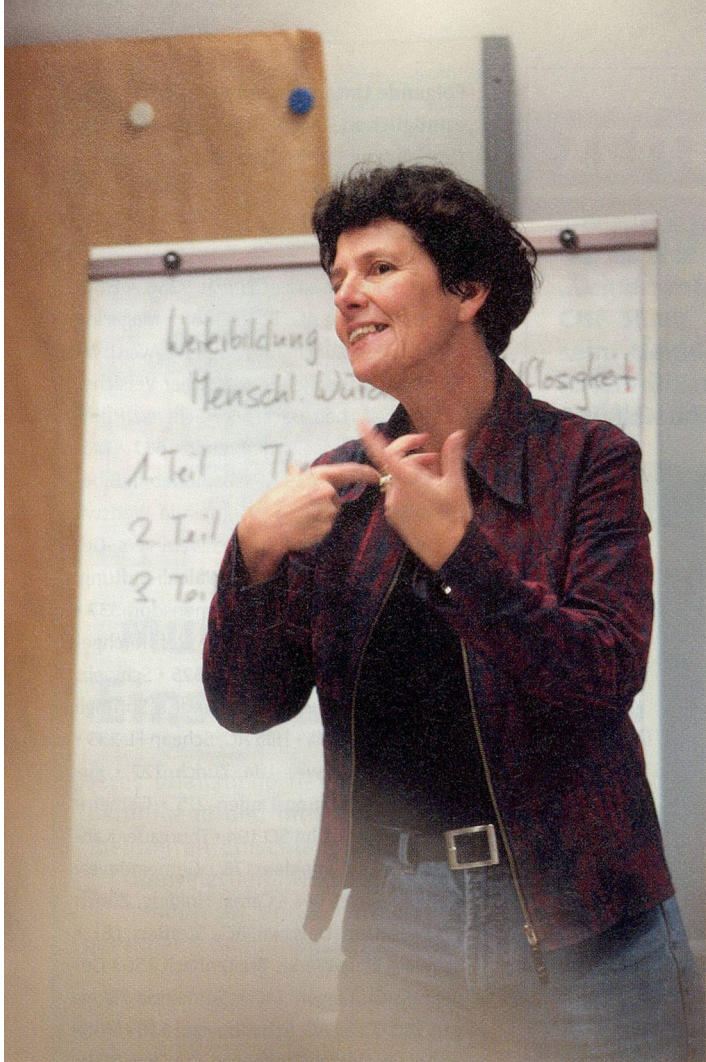
BILDER TRES CAMENZIND