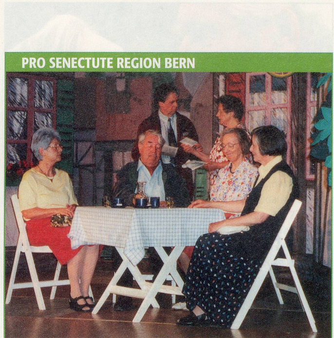
PRO SENECTUTE REGION BERN

Das neue Kursprogramm für die Regionen Sargans und Werdenberg für die kommenden Monate ist ab sofort erhältlich. Ende Oktober beginnt wieder eine Vielzahl von Kursen für Seniorinnen und Senioren: Englisch-, Italienisch- und Französischkurse auf verschiedenen Stufen, von Anfängern bis Fortgeschrittene. Wir bieten PC-Kurse, vom Einführungskurs bis zum Aufbaukurs, Internet- und E-Mail-Kurse an, ebenso wie digitale Bildbearbeitung am PC und die Gestaltung einer eigenen Homepage. Im kreativen Bereich stehen Kurse in Aquarellmalen und Kalligraphie zur Auswahl sowie neu der Kurs