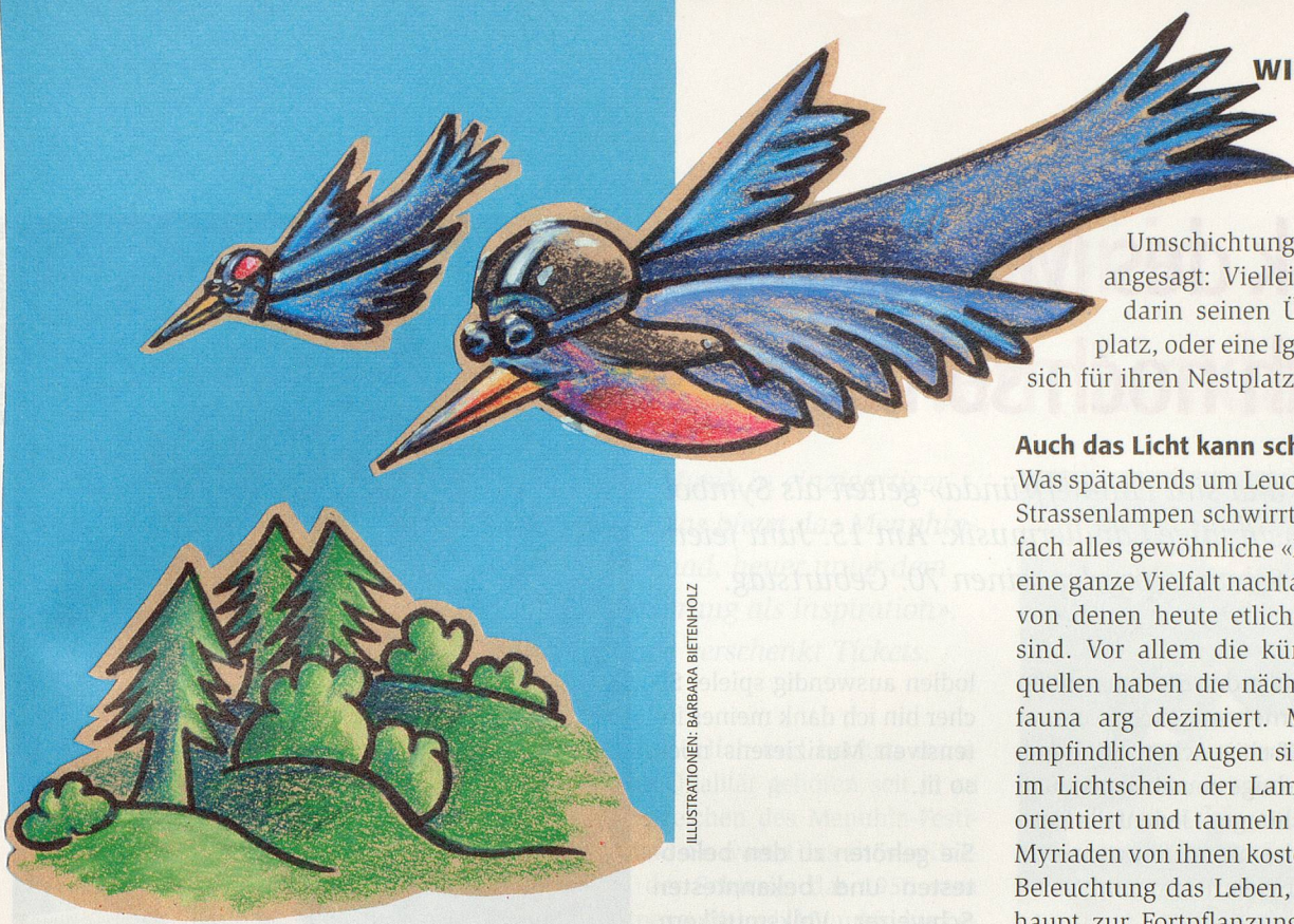
ILLUSTRATIONEN: BARBARA BIETENHOLZ

Lichtschächten den Tod. Solche Schächte sollten darum mit einem feinen Abdeckgitter versehen werden – je feiner, desto weniger Tiere fallen hinunter. Ein gegenüber dem Erdboden erhöhter Absatz verringert die Zahl der Opfer zusätzlich. Dieser wirkt für viele Kleintiere als Wanderhindernis.