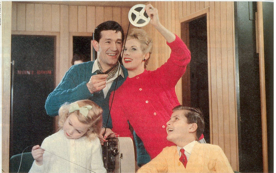
Nostalgie auf Zelluloid: Das Schmalfilmvergnügen von einst lässt sich bewahren.