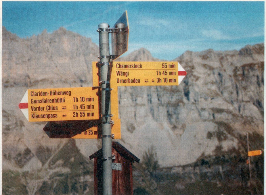
Eine Stunde auf den Stock: Der Wegweiser auf dem Fisetenpass vor den Jegerstöcken.

Wir gehen auf dem gleichen Weg zurück. Es gibt zwar Alternativen dazu: Man kann über Wängi auf den Urnerboden absteigen, das aber ist weit und geht in die Knie. Wir bleiben also auf dem Grat und geniessen das Panorama auch noch auf dem Rückweg. Das Bild ändert sich natürlich, man blickt nicht mehr ins Glarnerland hinaus, sondern Richtung Klausenpass. Dieser markante Gelände-