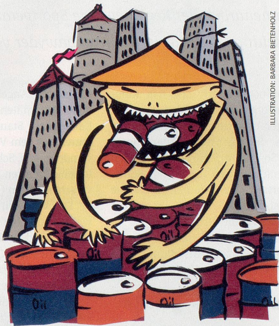
ILLUSTRATION: BARBARA BIETENHOLZ

Allein die für diese Volksmasse bereitzustellende Infrastruktur benötigt viel Stahl, der mithilfe von Nickel veredelt wird. Derweil die Chinesen dieses Metall vor der Jahrtausendwende kaum nachfragten, wird gemäss FuW bis 2010 ein Drittel der weltweiten