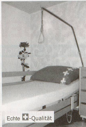
Echte + Qualität

Jetzt unverbindlich Unterlagen anfordern Tel. 071 672 70 80