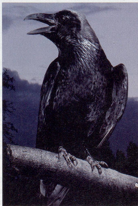
Raben haben ein eher düsteres Image: Wer hat Angst vorm schwarzen Vogel?

Bei der Nahrungssuche erweisen sich die einzelnen Tiere durchaus auch als Futterneider und verstecken vor ihrer Konkurrenz gelegentlich sogar ein paar Brocken im Boden. Es ist schon vorgekommen, dass Vögel, die dabei von anderen beobachtet wurden, später nochmals zu einem Versteck zurückkehrten und den Brocken an einen neuen Ort brachten. Das zeigt, dass Rabenvögel