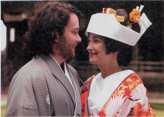
Heirat auf Japanisch: Noch stimmt alles mit Otto (Christian Ulmen) und Ida (Alexandra Maria Lara).