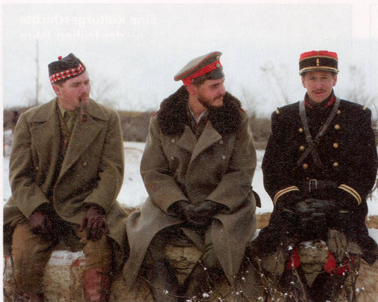
Weihnachten 1914: Schotte, Deutscher und Franzose friedlich vereint.