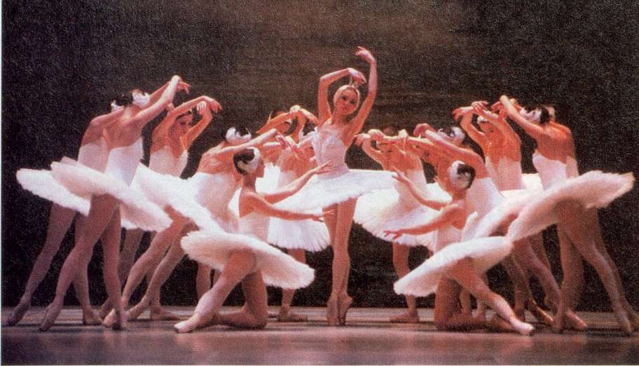
Tanz der Schwäne: Das Russische Staatsballett bringt ein legendäres Stück Russland.