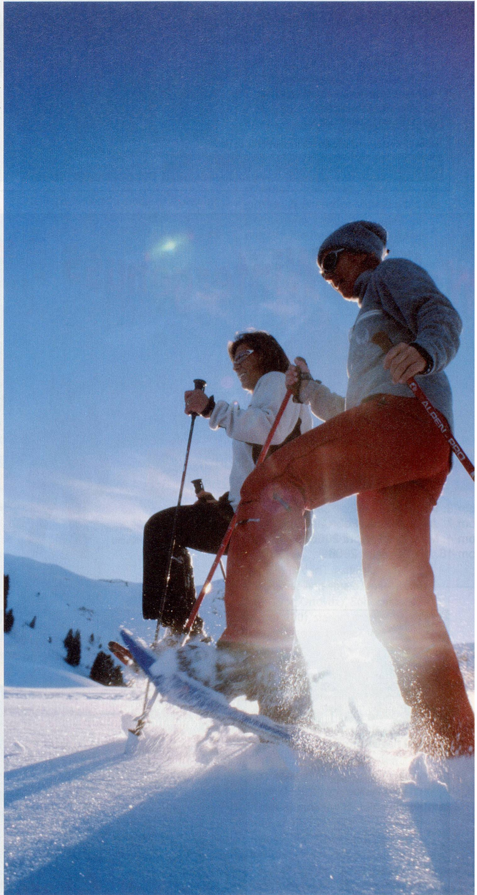
Immer obenauf: Das Schneetreten macht auch bei uns immer mehr Leuten Spass.