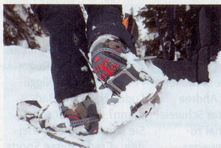
Auf grossem Fuss: Schneeschuhe machen das Gehen im Tiefschnee zum Vergnügen.

Und eben: Losgehen querfeldein. Querfeldein durch die verzuckerte Mär-