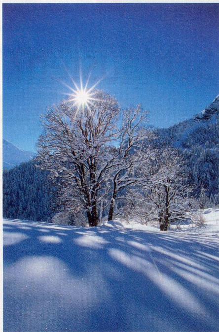
Wintertraum: Überzuckerte Landschaften sind ideales Schneeschuhgelände.

Die Lösung heisst: Spazieren und Wandern mit Schneeschuhen. Schneeschuhe sind eine wunderbare Entdeckung. Sie sind allen zu empfehlen, die sich gerne in der freien Natur bewegen und die gerne auf einer eigenen