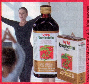
Vertriebs/LITANA Pharma AG, Kreuzlingen.

In Apotheken und Drogerien. Lesen Sie die Packungsbeilage.