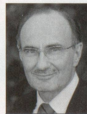
DAGEGEN: Prof. Dr. Felix Gutzwiller, Direktor Institut für Sozial- und Präventivmedizin Uni Zürich, Nationalrat und FDP-Fraktionschef

Selbstverständlich wäre es angenehm, sämtliche denkbaren medizinischen Leistungen in der Grundversicherung