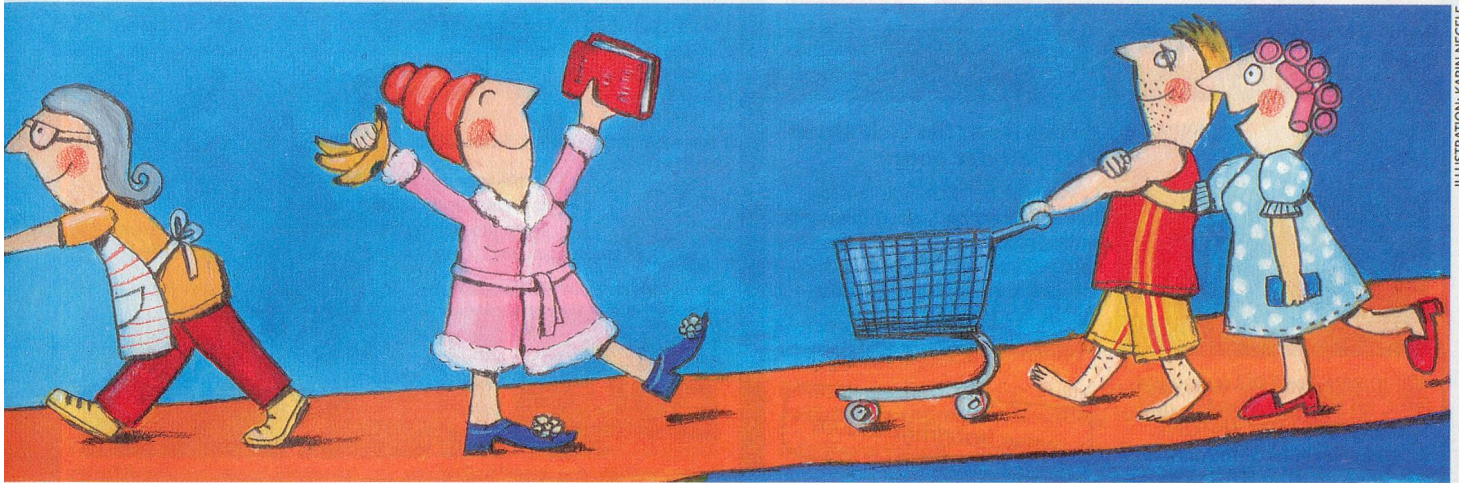
ILLUSTRATION: KARIN NEGELE

kel inklusive Preis und Menge gezeigt, den man bereits in den Einkaufswagen gelegt hat. Die Einkaufssumme wird jeweils neu berechnet und angezeigt. Artikel können dort auch jederzeit wieder entfernt werden. Findet man ein Produkt nicht gleich auf Anhieb, kann man mit Hilfe einer Suchfunktion den Internetshop nach dem gewünschten Artikel durchsuchen. Bei beiden Anbietern steht eine Anleitung zur Verfügung, welche die Funktionsweise des Internetsops erklärt.