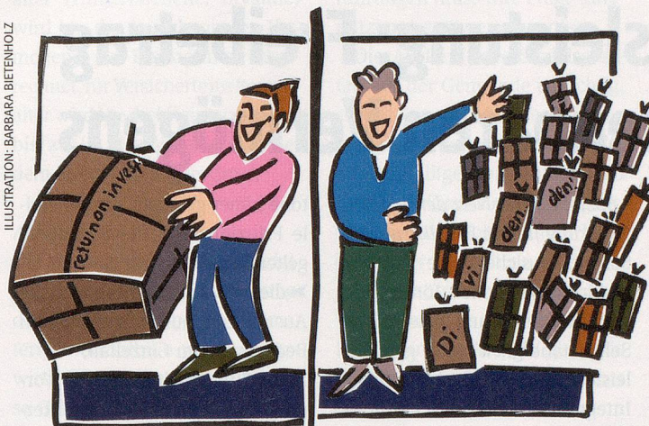
ILLUSTRATION: BARBARA BIETENHOLZ

wert behelfen. Dieser lässt sich berechnen, indem von den in der Bilanz ausgewiesenen Aktiven das Fremdkapital abgezogen wird. Je besser das Verhältnis von Eigenkapital zu Fremdkapital ist, desto eher qualifiziert sich ein solches Unternehmen für die Value-Liga. Liegt der Substanzwert pro Anteil in der Nähe des aktuellen Börsenkurses oder gar darunter, ist diesem Papier die Zuneigung eines Wert-Investors gewiss.