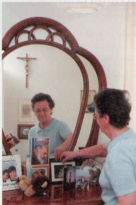
Liebe Erinnerungen: Auch Souvenirs an früher gehören zur Oasi-Stimmung.

Zwar hatten einige der Frauen und Männer, die inzwischen in der Oasi leben, in der Schweiz auch Deutsch gelernt. Doch Erfahrungen und Erkenntnisse aus der Altersarbeit zeigen, dass mit zunehmendem Alter die Muttersprache in den Vordergrund tritt. Einige der heutigen Oasi-Bewohnerinnen sind von tra-