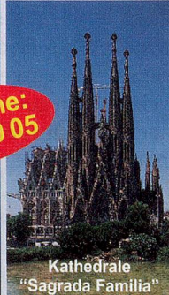
Kathedrale "Sagrada Familia"