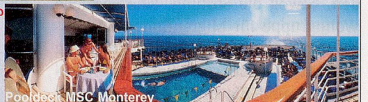
Pooldeck MSC Monterey

Reisebegleitung ab der Schweiz und zurück! Einzelkabine zum Hit-Preis! Arzt an Bord!