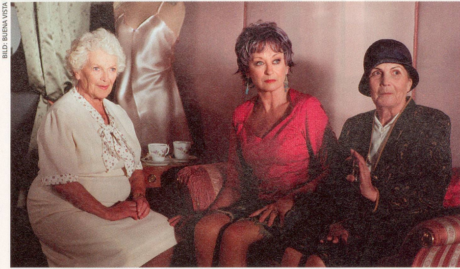
Frivoles Dreimäderlhaus: Martha (Stephanie Glaser) mit Lisi (Heidi Maria Glössner) und Frieda (Annemarie Düringer) in ihrem neuen Lingeriegeschäft.