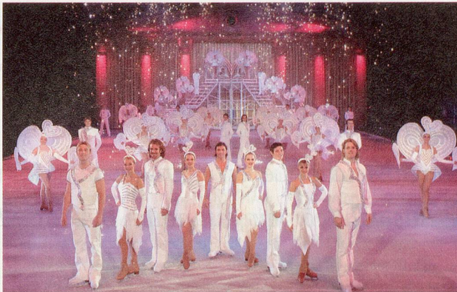
Liebevolle Show: In diesem Jahr wird bei Holiday on Ice grosse Leidenschaft zelebriert.