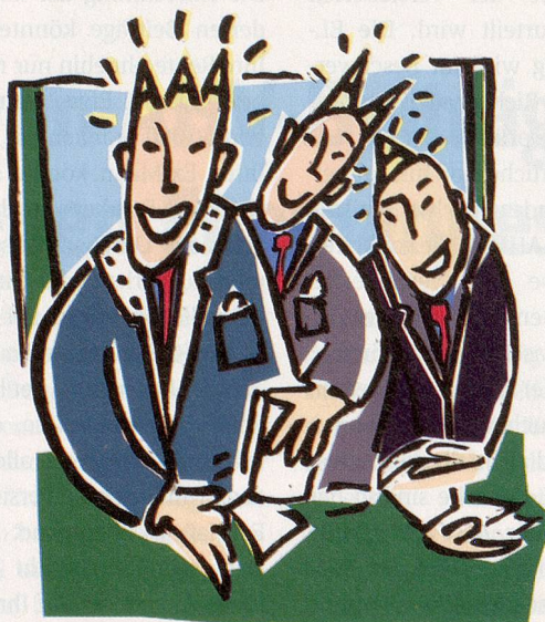
ILLUSTRATION: BARBARA BIETENHOLZ

geln können sich die Anleger ein Bild über ihren Schuldner machen, selbst wenn sie von ihm nur den Namen kennen. Nun kann man argumentieren, dass Private