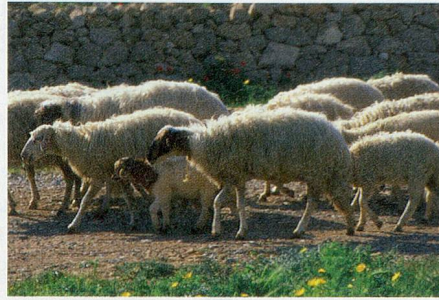
Einheimische: Wenn eine Schafherde den Weg in Besitz nimmt, heisst warten.

Wer sich eine Pause vom Wandern gönnen möchte, dem bietet die faszinierende Insel ein fast unbeschränktes kulturelles Angebot – unter anderem sehr gut erhaltene Mosaik im Archäologischen Park in Pafos, prächtige Klöster und diverse Museen, wie etwa das «Cyprus Wine Museum» in Erimi, wo