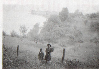
BILDER: THURGAUISCHE KUNSTGESELLSCHAFT