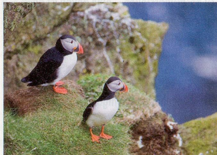
Der Natur ganz nah: Papageitaucher im Vogelparadies Herma Ness auf Unst.

Jeden Abend zur Cocktailstunde sitzen Kapitän Heiko Volz und Esther Bruns mit ihren Gästen zusammen und besprechen die Aktivitäten des nächsten Tages. Vorgegeben sind nur der Ausschiffungs- und der Zielhafen – dazwischen kann die Route dem Wetter und den Wünschen der Passagiere angepasst werden. Alle können mitreden, Vorschläge machen, Höhepunkte aus dem Reise-