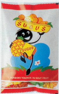
Sugus, 400 g, 5.45

Zum Jubiläum von Pro Senectute finden Sie bei Coop vom 4. bis 15. September 2007 ausgewählte Angebote im Nostalgiedesign, von denen 10% des Verkaufspreises an Pro Senectute gehen.