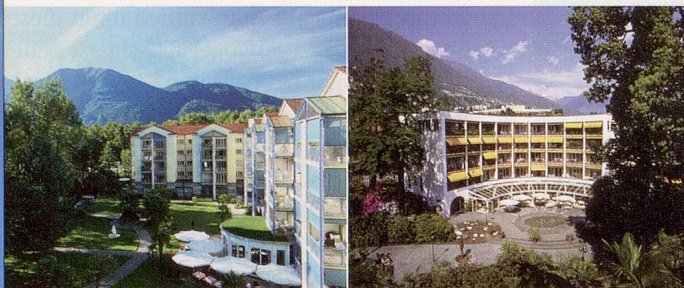
TERTIANUM Al Lido