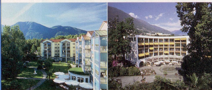
TERTIANUM Al Lido