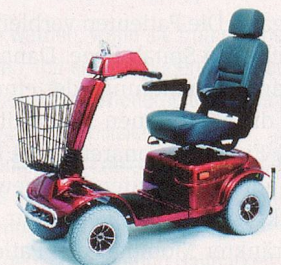
329LE – stark, komfortabel und grosse Reichweite.