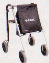
Avant LW – sehr gute Ergonomie und sehr leicht (5.8kg).

Verlangen Sie unsere Dokumentation und Händlerliste.