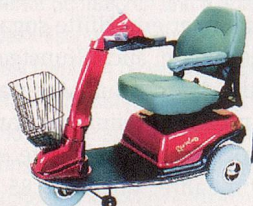
600T – komfortabel, wendig, kompakt.

Liteway 3 / 4 – wendig und stabil, mit 3 oder 4 Rädern, leicht faltbar und transportierbar.