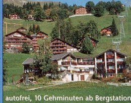
autofrei, 10 Gehminuten ab Bergstation

Geniessen Sie ein paar Tage Ruhe und Erholung im schönen Braunwald, 1 Std. von Zürich entfernt. Erleben Sie gepflegte Gastlichkeit in zauberhafter Umgebung. Feine Küche. Diverse Kursangebote.