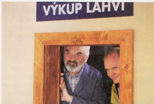
Ort der Kontakte und Gespräche: die Leergutannahme im Supermarkt.