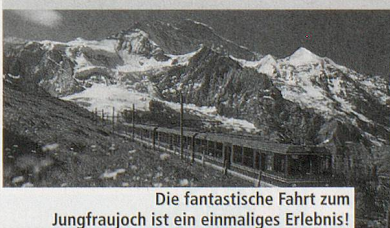
Die fantastische Fahrt zum Jungfrauojoch ist ein einmaliges Erlebnis!