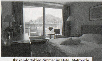
Ihr komfortables Zimmer im Hotel Metropole

Hotel Metropole ****, Interlaken Das beliebte 4-Sterne-Hotel Metropole liegt im Stadtzentrum von Interlaken und ist ideal für erstklassige und unvergessliche Tage inmitten der grandiosen Berg- und Seenlandschaft. Ihr komfortables Zimmer verfügt über TV, Radio, Telefon, Minibar, Bad/Dusche WC und Balkon. Nutzen Sie das vielseitige kulinarische Angebot von der asiatisch angehauchten Metrobar über das Spezialitätenrestaurant Bellini bis hinauf in die 18. Etage zum Restaurant Top o'Met mit Traumaussicht! Ein Poolbereich mit Sauna und Solarium sowie ein vielfältiges Fitnessprogramm rundet das Angebot ab und sorgt für aktive Erholung.