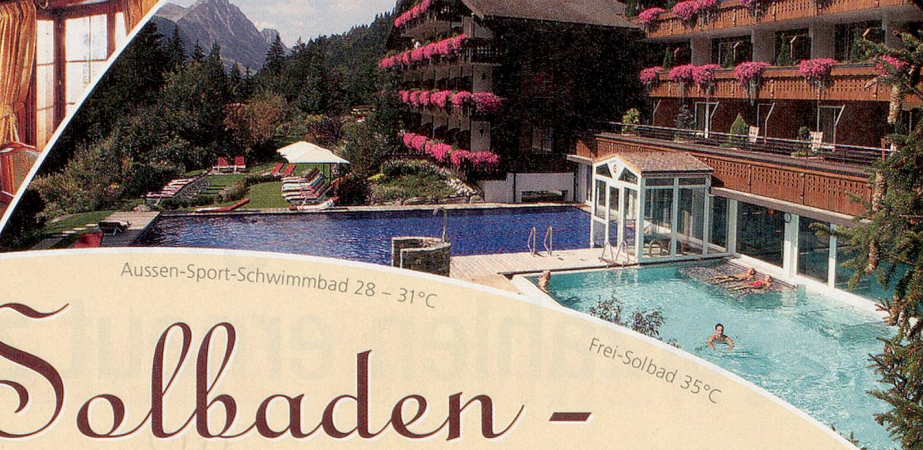
Aussen-Sport-Schwimmbad 28 – 31°C