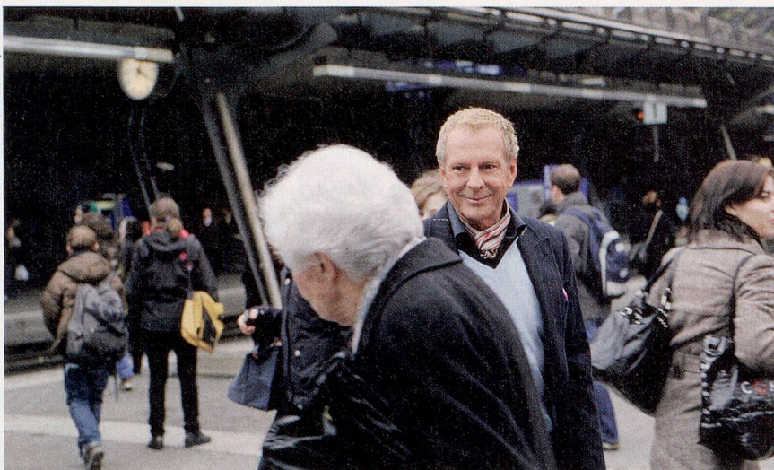
Kurt Aeschbacher nimmt uns mit Liebesgeschichten von früher auf eine Zeitreise mit.