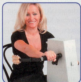
Nur Arme bewegen