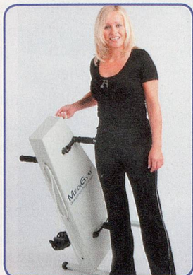
Einfach und leicht zu transportieren

Hält Sie aktiv, fit und beweglich bis ins hohe Alter Schont Gelenke und Knochen – ohne Sturzgefahr Seit 20 Jahren erprobt von Senioren und Reha Kunden