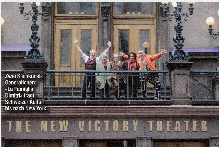
Zwei Kleinkunst- Generationen: «La Famiglia Dimitri» trägt Schweizer Kultur bis nach New York.