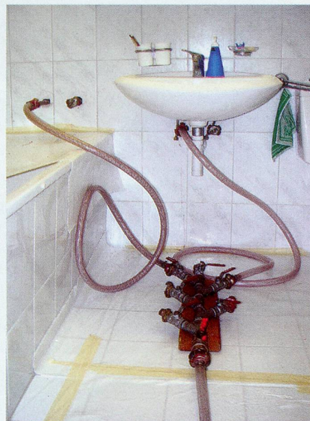
Nach der Rohr-Reinigung erfolgt die Innenbeschichtung der Wasserleitungen mit Epoxydharz.

Eine Innen-Sanierung der Leitungen durch Lining Tech AG ist 3x günstiger sowie 10x schneller als eine Neu-Installation. Ohne bauliche Umtriebe.