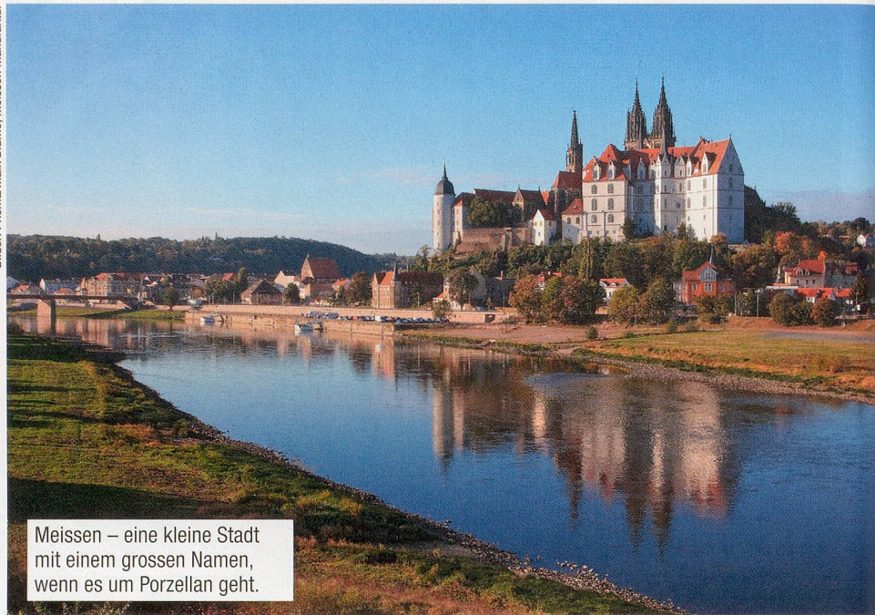
Meissen – eine kleine Stadt mit einem grossen Namen, wenn es um Porzellan geht.