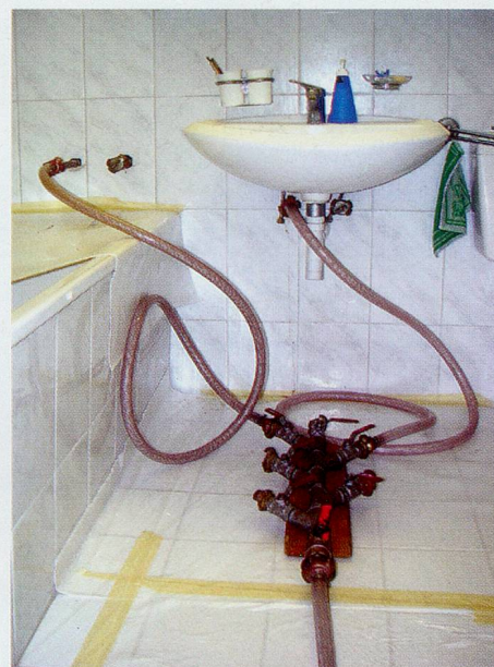
Nach der Rohr-Reinigung erfolgt die Innenbeschichtung der Wasserleitungen mit Epoxydharz.

Eine Innen-Sanierung der Leitungen durch Lining Tech AG ist 3x günstiger sowie 10x schneller als eine Neu-Installation. Ohne bauliche Umtriebe.