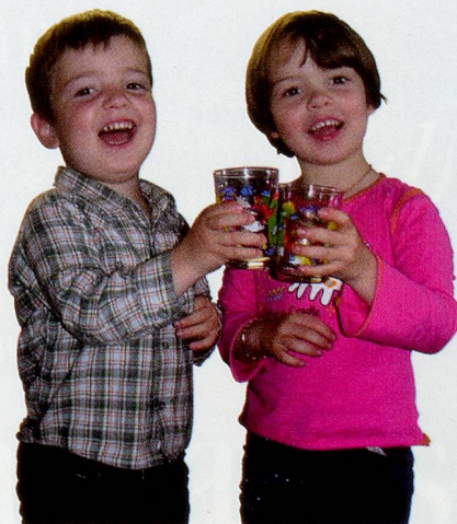
...und Trinkwasser hat wieder seinen Namen verdient!