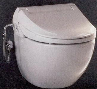
WC-Aufsatz: Geberit AquaClean 4000