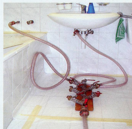
Nach der Rohr-Reinigung erfolgt die Innenbeschichtung der Wasserleitungen mit Epoxydharz.

Eine Innen-Sanierung der Leitungen durch Lining Tech ist 3x günstiger sowie 10x schneller als eine Neu-Installation. Sie erfolgt ohne bauliche Umtriebe und ist ausserdem umweltfreundlich. Sämtliche Räume bleiben während der ganzen Sanierung bewohn- und benutzbar.