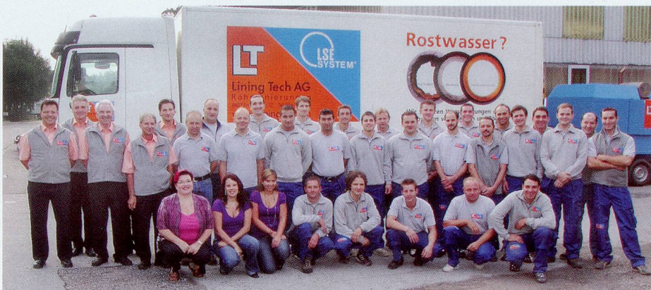
Lining Tech AG, die Nr. 1 in der Schweiz, saniert pro Jahr über 1500 Wohnungen in der Deutschschweiz inklusive Wallis sowie im Tessin.

Das Hygiene-Institut Gelsenkirchen beglaubigt betreffend Mikroorganismen im Trinkwasserbereich für Kalt- und Warmwasser die hygienisch einwandfreie Qualität des Trinkwassers in den sanierten Wasserleitungen.