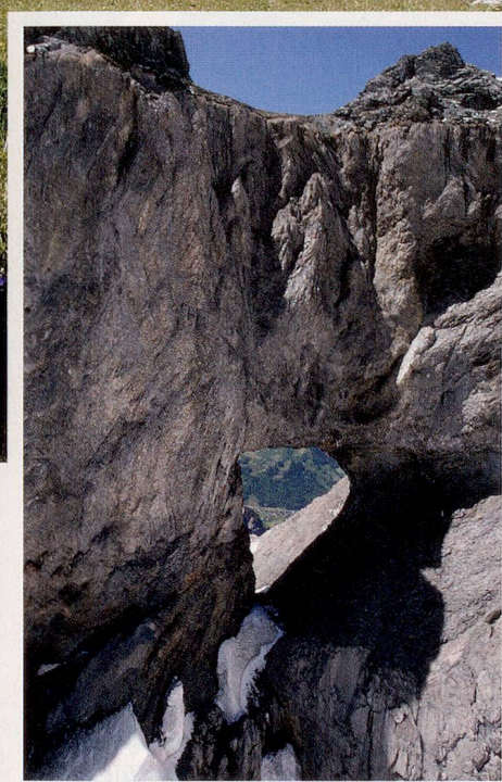
Das Martinsloch (kleines Bild) und die Tsingelhörner mit der gut sichtbaren Überschiebungslinie: Hier kommt die Erdgeschichte ans Tageslicht.

geschichte in die Öffentlichkeit tragen. Diese hat am 28. und 29. Mai 2010 zum zweiten Mal nach 2007 die Gelegenheit, sich mit «Erlebnis Geologie» auf Spurensuche zu begeben. Wanderungen und Exkursionen, Besichtigungen und Führungen sollen Ausflüge in eine Millionen von Jahren zurückliegende Vergangenheit ermöglichen und gleichzeitig die Bedeutung der Geologie für den heutigen Alltag aufzeigen.