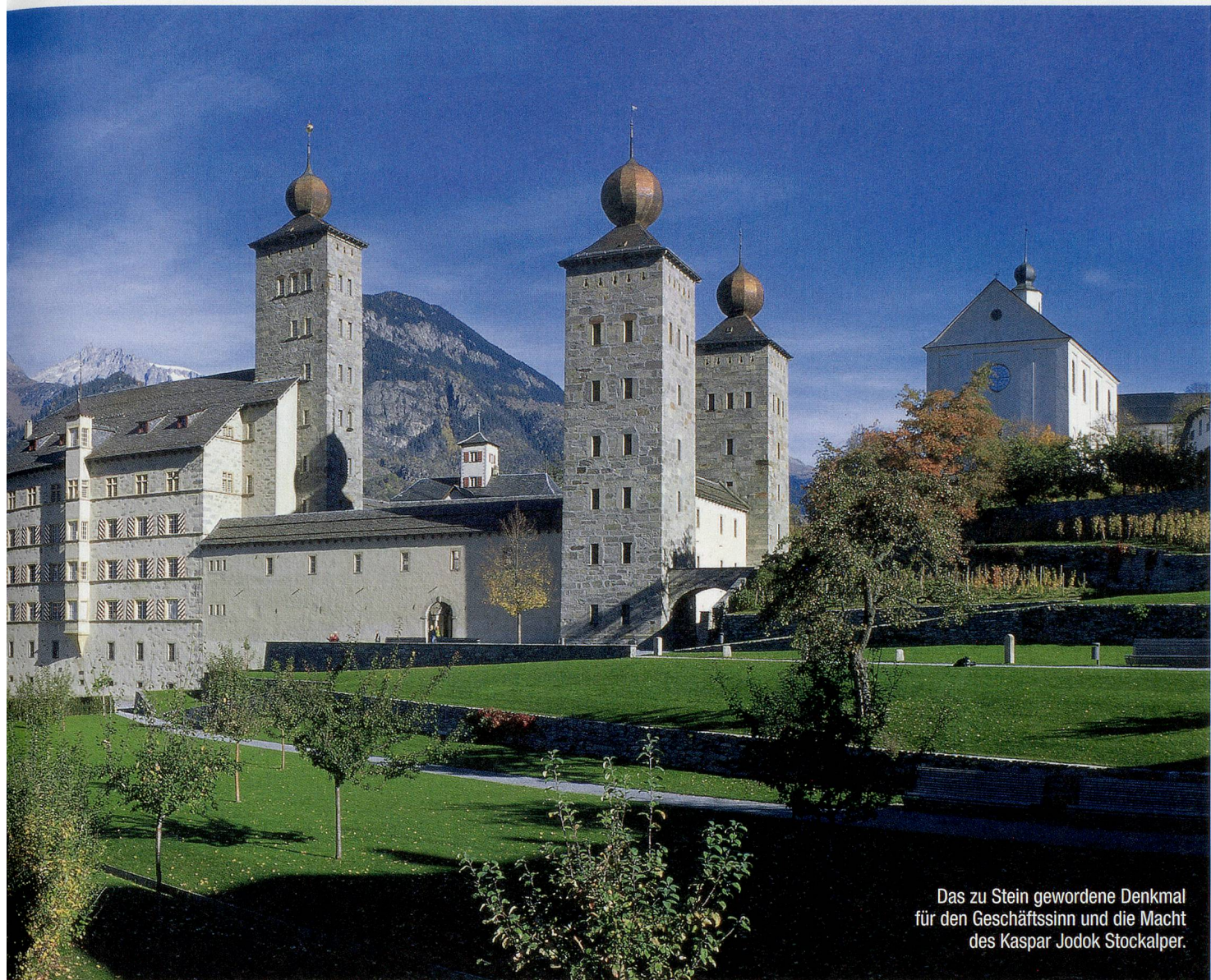
Das zu Stein gewordene Denkmal für den Geschäftssinn und die Macht des Kaspar Jodok Stockalper.

te ihnen Klöster, Schulen und Heime. Mit Stockalper wurde Brig zum Bildungszentrum des Oberwallis.