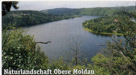
Naturlandschaft Obere Moldau