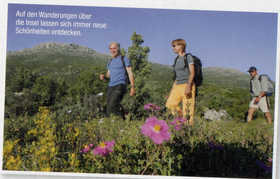
Auf den Wanderungen über die Insel lassen sich immer neue Schönheiten entdecken.

Samstag: Transfer zum Flughafen und Rückflug in die Schweiz oder individuelle Verlängerungswoche.