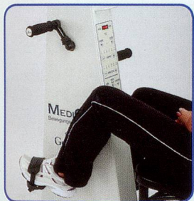
Nur Beine bewegen