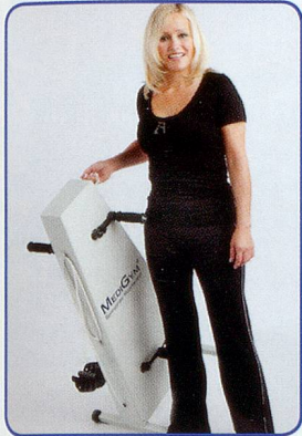
Einfach und leicht zu transportieren

Hält Sie aktiv, fit und beweglich bis ins hohe Alter Schont Gelenke und Knochen – ohne Sturzgefahr Seit 20 Jahren erprobt von Senioren und Reha Kunden