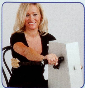
Nur Arme bewegen