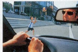
Blendfreie Sicht mit polarisierender Sonnenbrille.

Weitere Informationen finden Sie unter: www.polaroideyewear.ch