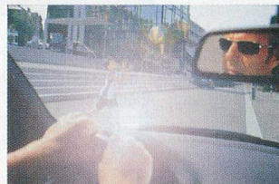
Ohne polarisierende Sonnenbrille.

Elf verschiedene Modelle berücksichtigen unterschiedliche Brillengrössen und individuelle Modewünsche. Dank des moderaten Preises von CHF 59.90 (Kindermodell CHF 39.90) lässt sich auch ein zweiter oder dritter Sonnenschutz als Reserve im Handschuhfach bereithalten, ohne das Budget gross zu belasten. Erhältlich im Optikfachhandel.