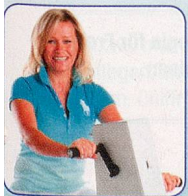
Nur Arme bewegen