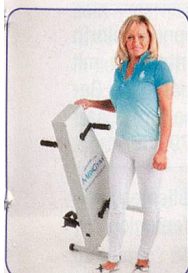
Einfach und leicht zu transportieren

Hält Sie aktiv, fit und beweglich bis ins hohe Alter Schont Gelenke und Knochen – ohne Sturzgefahr Seit 20 Jahren erprobt von Senioren und Reha Kunden