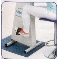
Nur Beine bewegen