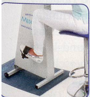
Nur Beine bewegen