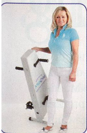
Einfach und leicht zu transportieren

Hält Sie aktiv, fit und beweglich bis ins hohe Alter Schont Gelenke und Knochen – ohne Sturzgefahr Seit 20 Jahren erprobt von Senioren und Reha Kunden