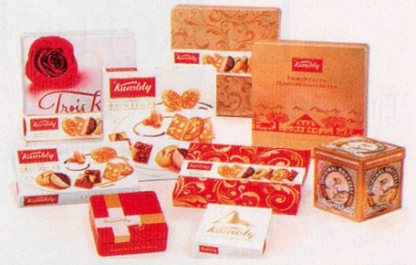
Die Freude, Freude zu bereiten, kennt keine Grenzen und spricht jede Sprache.

Was gibt es Schöneres, als etwas Feines und Edles zu schenken? Ein kleines Dankeschön, eine liebevolle Überraschung, ein Zeichen der Freundschaft. Zum Beispiel mit einer Kollektion meisterhaft kreierten Kambly Feingebäcks.