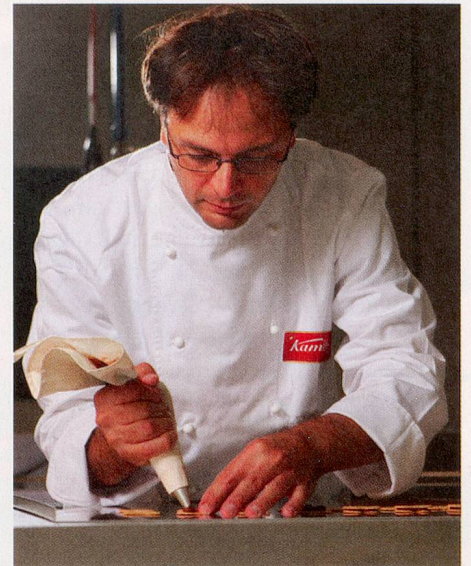
Die einzigartigen Kambly Feingebäck Kreationen werden liebevoll hergestellt – wie von des «Mître Chocolatier et Pâtissier» Meisterhand.

der Dankbarkeit und des Respekts vor den Gaben der Natur. Echt Gutes und Schönes will von Herzen kommen.