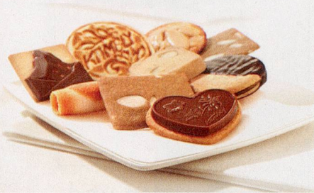
Jede Feingebäck-Spezialität von Kambly ist einzigartig und eine Persönlichkeit.

Es sind besondere Momente, an die wir uns alle gerne erinnern: mit der Mutter feine Guetzli backen, mit den Kindern etwas Neues ausprobieren, seine Lieben und sich selbst mit etwas Feinem überraschen, sich freuen und